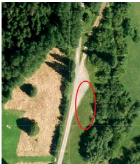
Označenie umiestnenia workoutového ihriska v Podolínskej doline

Mesto Podolíneec sa usiluje získavať prostriedky z externých zdrojov. Od začiatku roka 2019 bolo pripravených niekoľko žiadostí. Prvou z nich bolo podanie žiadosti podľa všeobecne záväzného nariadenia PSK o poskytovaní dotácií z vlastných príjmov Prešovského samosprávneho kraja. V rámci tejto žiadosti sme požiadali o príspevok vo výške 5 000 € na výstavbu workoutového ihriska v doline pri vlekoch. Ďalšou v poradí bola žiadosť