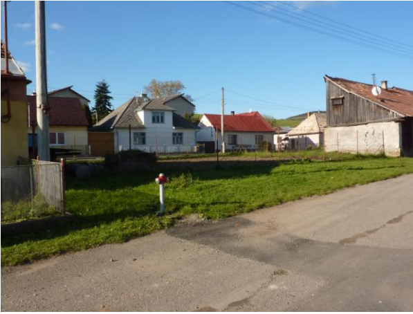
279. Pohľad na ul. J. Smreka z Baštovej Glos 2010