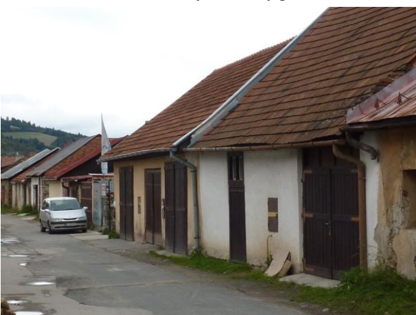
232. Južný front stodôl na Letnej Glos 2010