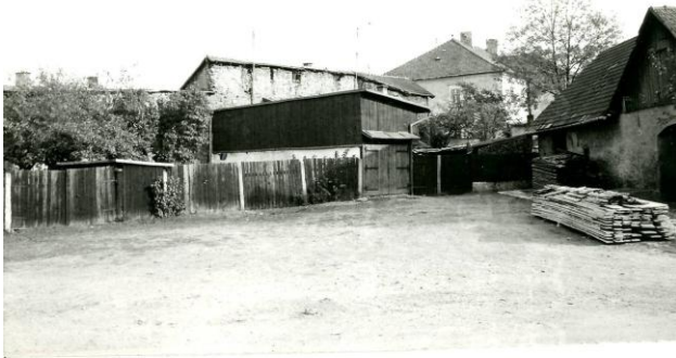
275. Sláma 1988 Archív PÚ SR č. neg. 101606