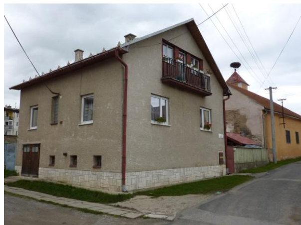
248. Zimná 1 - Rodinný dom Glos 2010