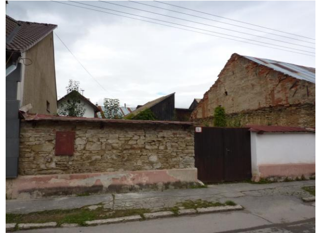
221. Letná 5 - Rezerva pre výstavbu RD Glos 2010