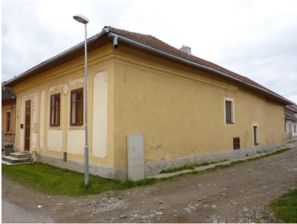
287. T. Vansovej 7 - Meštiansky dom NKP Glos 2010