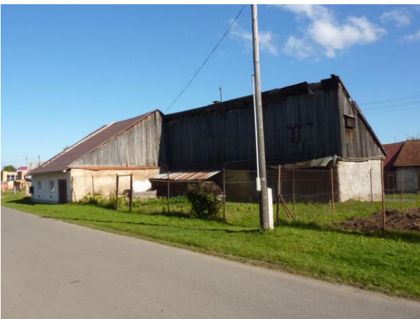
283. J. Smreka, domy na Baštovej 21 a 22 Glos 2010