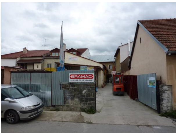
230. Letná ul., urbanisticky narušený priestor Glos 2010