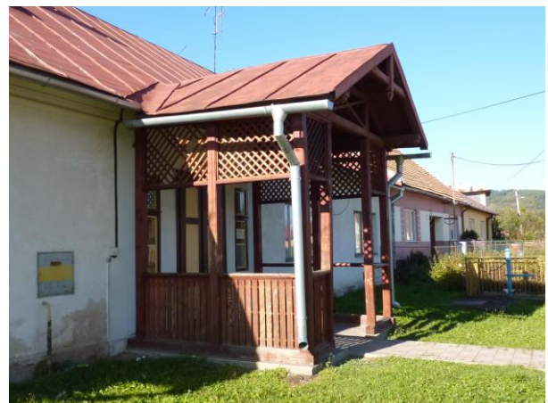
286. Krytý vstup domu na ul. J. Smreka Glos 2010