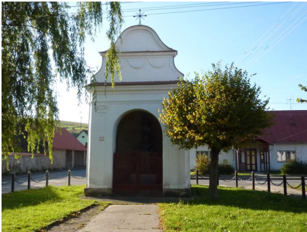
273. Kaplnka sv. Jána Nepomuckého NKP Glos 2010