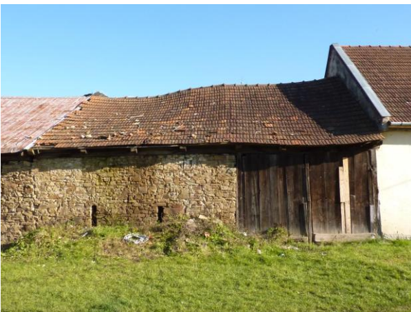
259. Typická stodola J frontu ulice Glos 2010