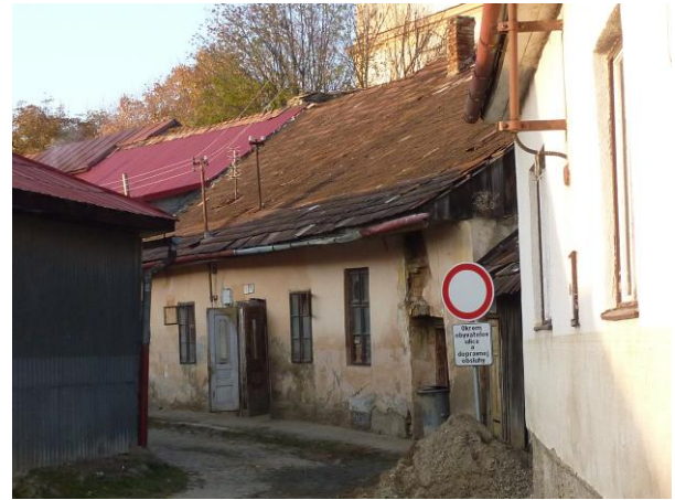
264. Kláštorňá 5 Glos 2010