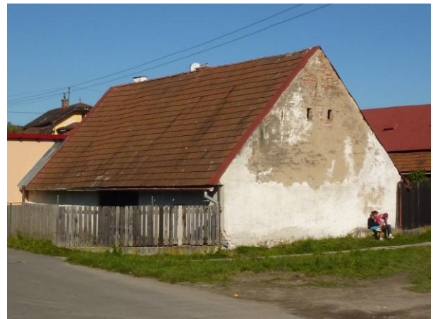
276. J. Smreka, stodola – návrh NKP Glos 2010