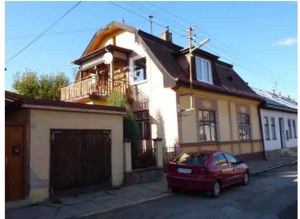
249. Baštová 1