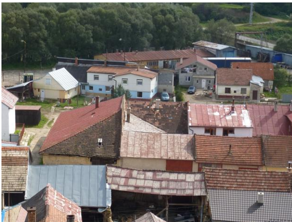
295. T. Vansovej – živelná výstavba