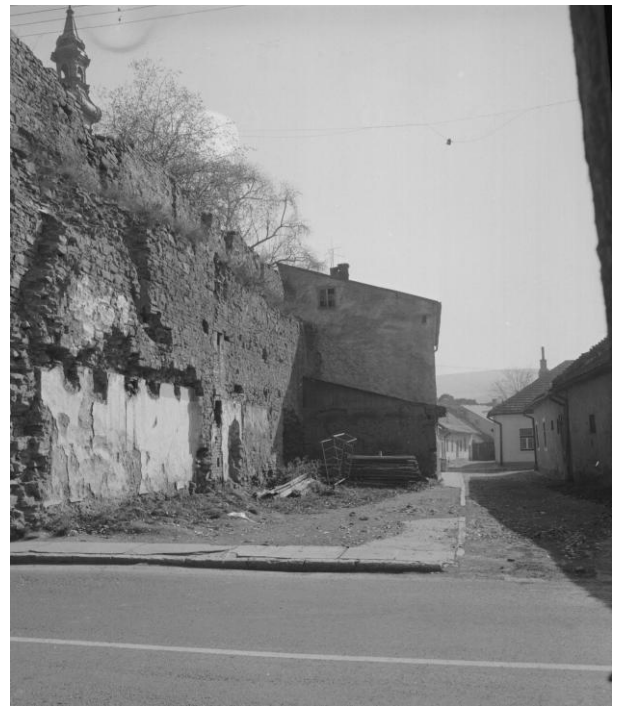
270. Kláštorná ul. – vyústenie na hlavnú komunikáciu