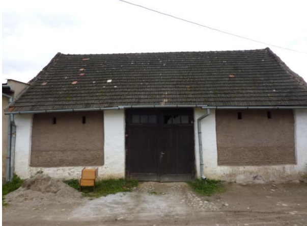
245. Murovaná stodola domu MN 41 Glos 2010