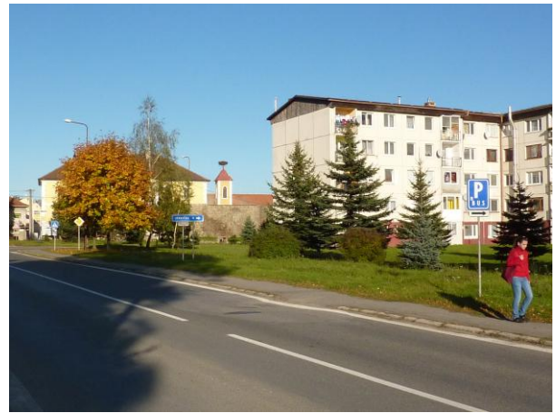
302. Sídliisko na Bernolákovej ul.