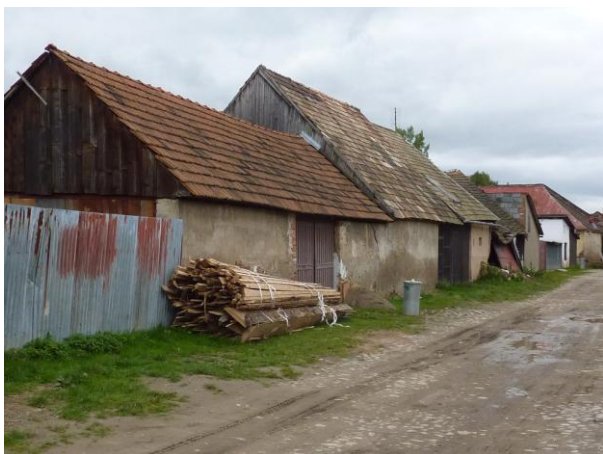
243. Zimná ul. – Stodoly južného frontu Glos 2010