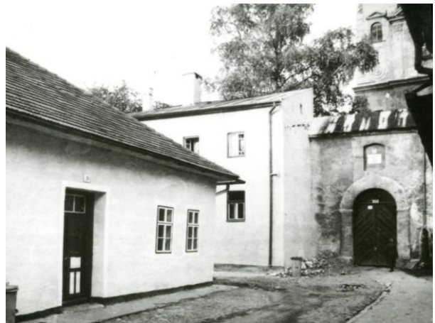
266. Sláma 1988 Archív PÚ SR č. neg. 101618