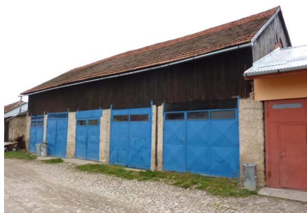
244. Stodola domu Mariánske nám. č. 48 Glos 2010