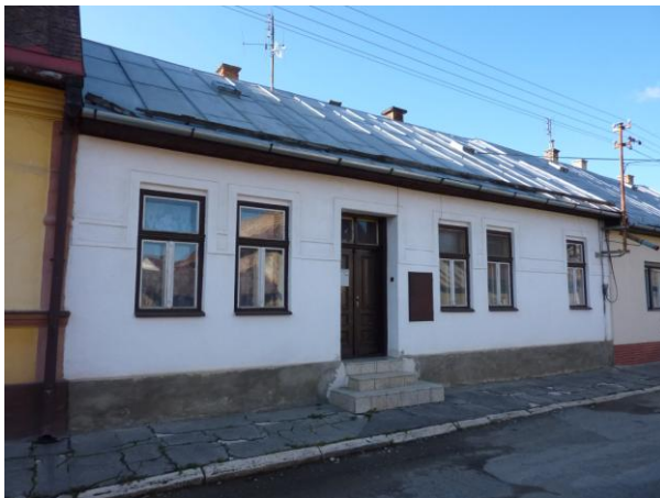
251. Baštová 7 – typický rodinný dom