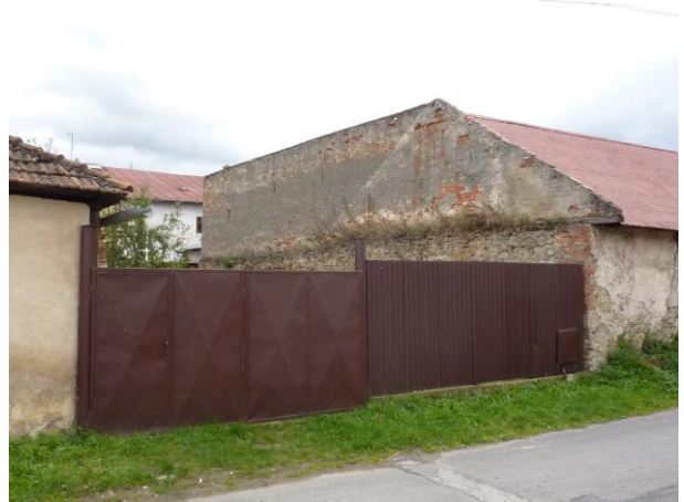
229. Letná, rezerva pre hospodársku stavbu Glos 2010