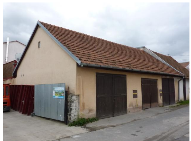
231. Príklad hmotovej repliky stodoly Glos 2010