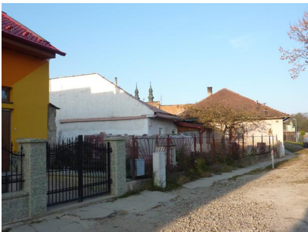
267. Kláštorňá ul. Glos 2010