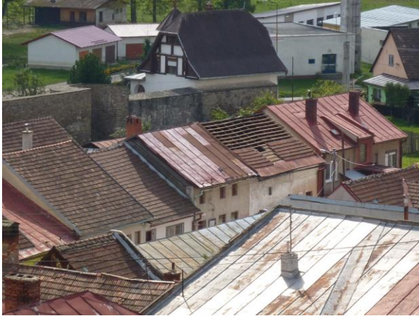
234. Pohľad z veže farského kostola Glos 2010