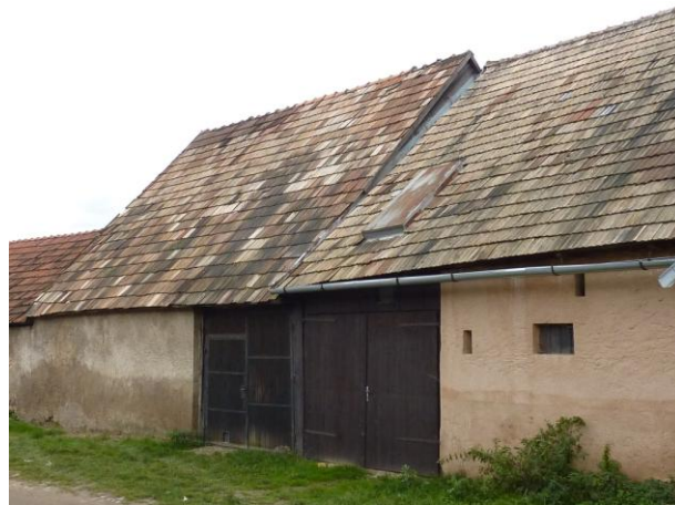
242. Zimná ul. – Tradičné stodoly Glos 2010