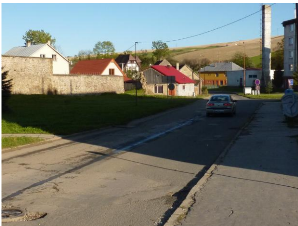
303. Zástavba Z časti Bernolákovej