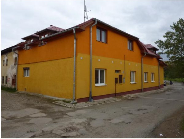
293. T. Vansovej 1 NKP