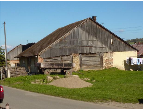
281. J. Smreka, rodinný dom na Baštovej 20 Glos 2010