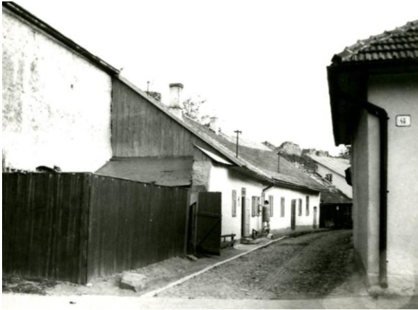
263. Sláma 1988 Archív PÚ SR č. neg. 101644