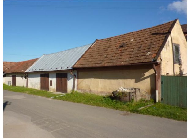
280. Typické stodoly J frontu ulice Glos 2010