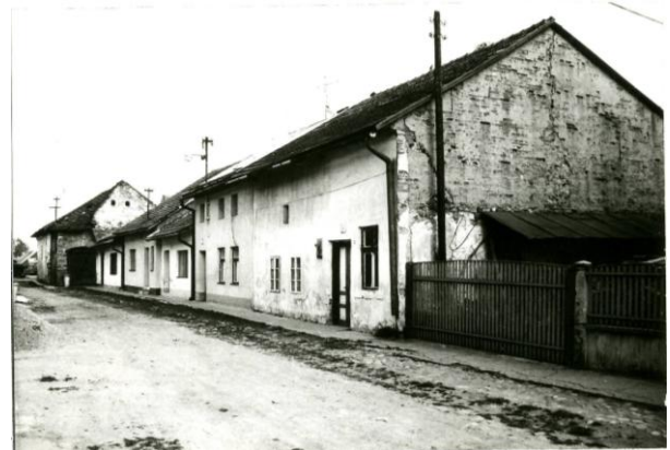
237. Sláma 1988 Archív PÚ SR č. neg. 101598