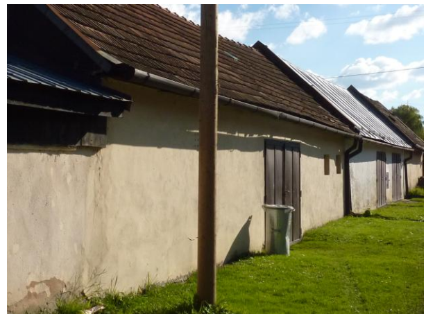
284. Typické stodoly J frontu ulice Glos 2010