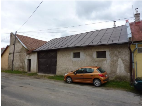
228. Letná ul. – Stodola za farou Glos 2010