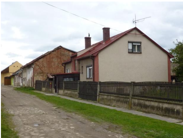
236. Zimná 3 - 9. Glos 2010