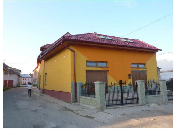
294. T. Vansovej 1 NKP, zadná hosp. časť Glos 2010