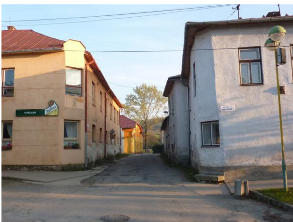
291. Ulica Terézie Vansovej Glos 2010