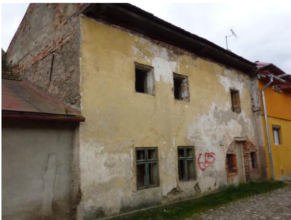
238. Zimná 9/132 Meštiansky dom NKP Glos 2010