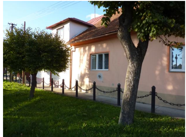
274. Domy na ul. J. Smreka pri kaplnke Glos 2010