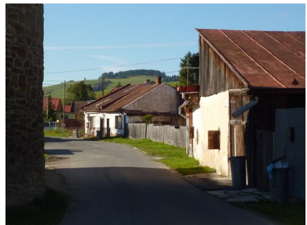
262. Západné ukončenie Baštovej ul. Glos 2010