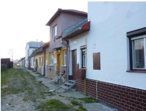
265. Kláštorňá ul. – radová zástavba Glos 2010