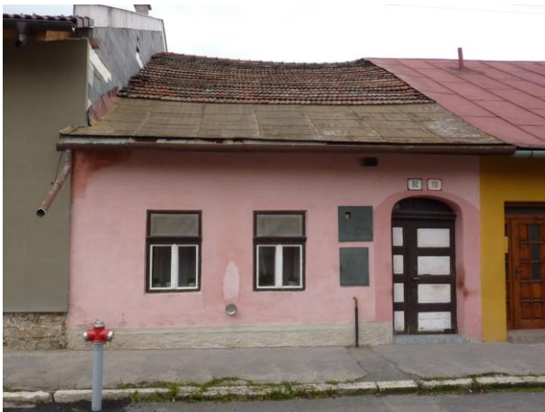
222. Letná 10 – Tradičný dom Glos 2010