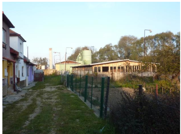
268. Kláštorňá ul., vzadu areál píly Glos 2010