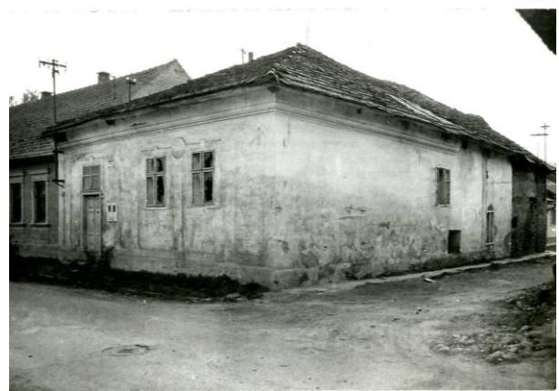
288. Sláma 1988 Archív PÚ SR č. neg. 101599