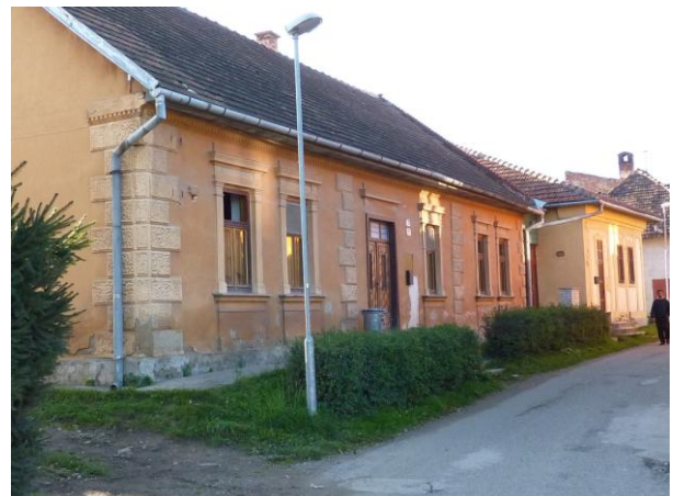
290. T. Vansovej 6 – sporné vyhlásenie NKP Glos 2010