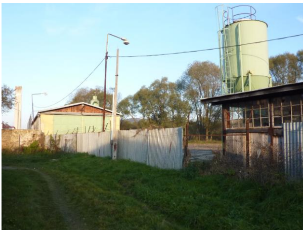
297. T. Vansovej – nevhodná prevádzka pily Glos 2010