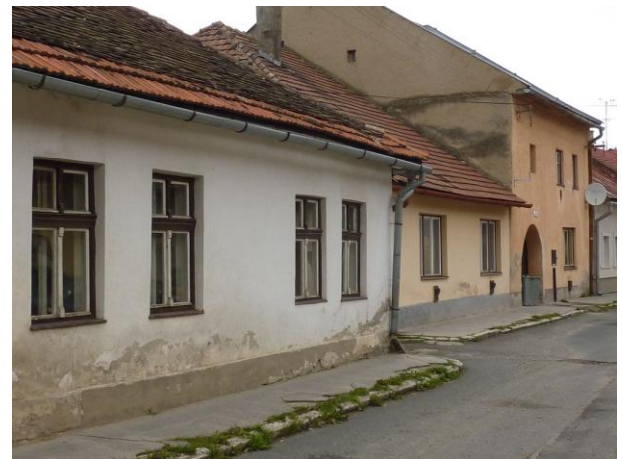
225. Letná 14-16 Glos 2010