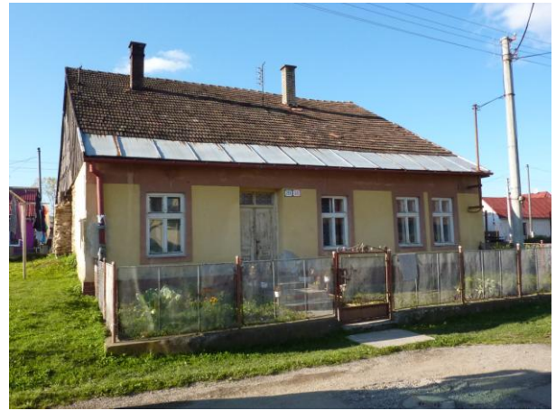
254. Baštová 20