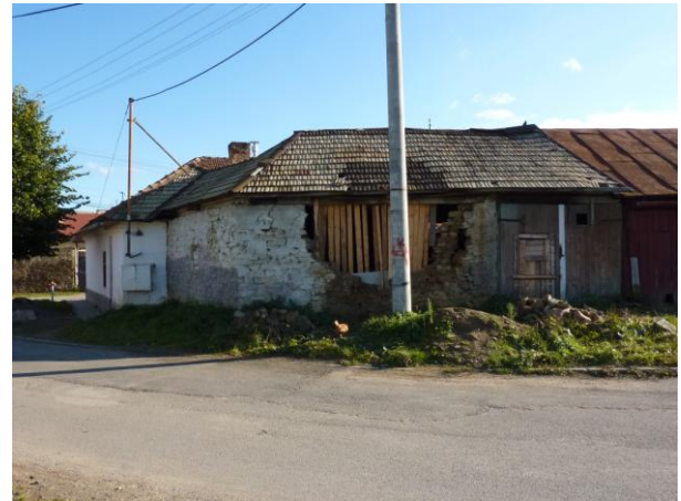
258. Stodola domu na Letnej 27 Glos 2010