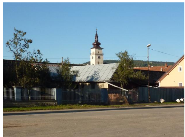
306. Bernolákova - zástavba pri JZ hradbe