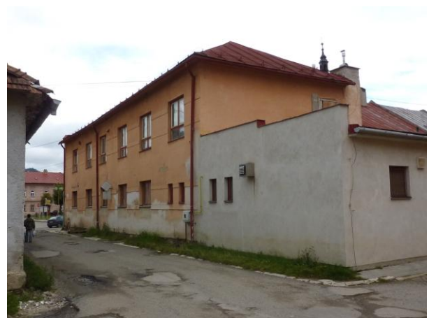
292. T. Vansovej. Dom Mariánskom nám. 57 Glos 2010