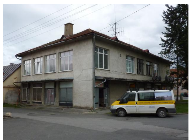
233. Dom služieb z Letnej Glos 2010