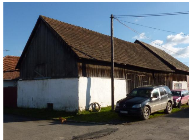
260. Stodola J frontu – návrh na NKP Glos 2010