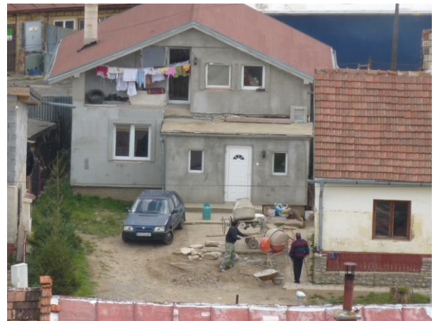
296. T. Vansovej – pohľad z veže - detail Glos 2010