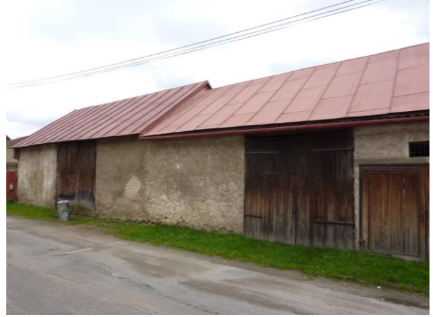
227. Letná ul. – Tradičné stodoly Glos 2010