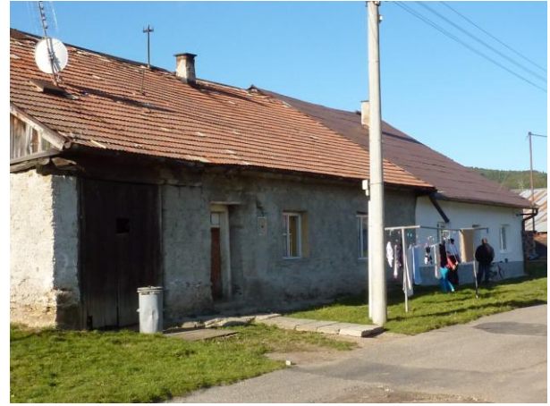
256. Baštová 21, 22 Glos 2010