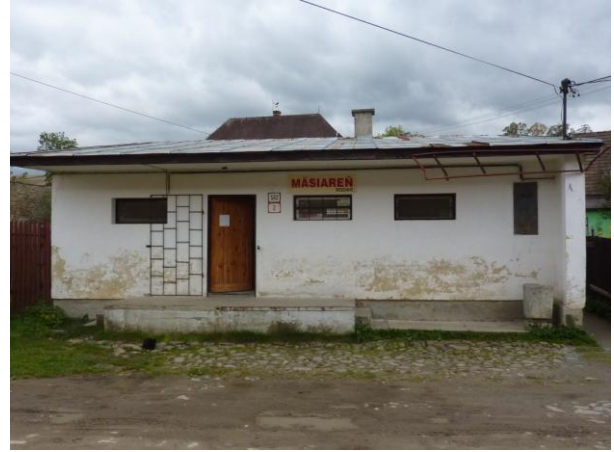
235. Zimná 2 – Predajňa Glos 2010