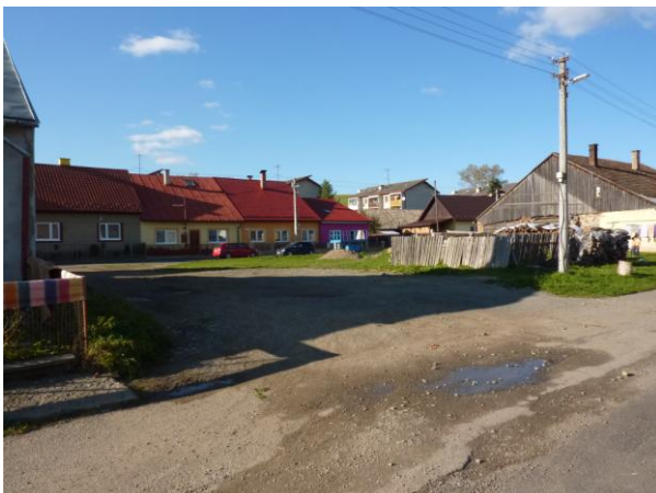
277. Pohľad na ul. J. Smreka z Baštovej Glos 2010