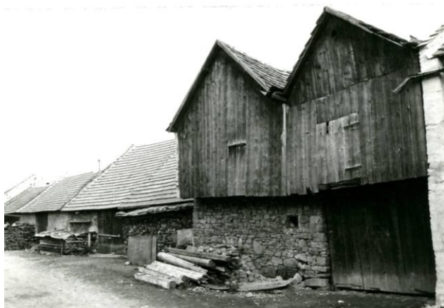
241. Sláma 1988, Zimná ul. Archív PÚ SR č. neg. 101596