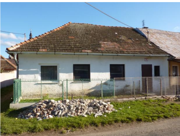
261. Baštová 18 na J strane ulice Glos 2010