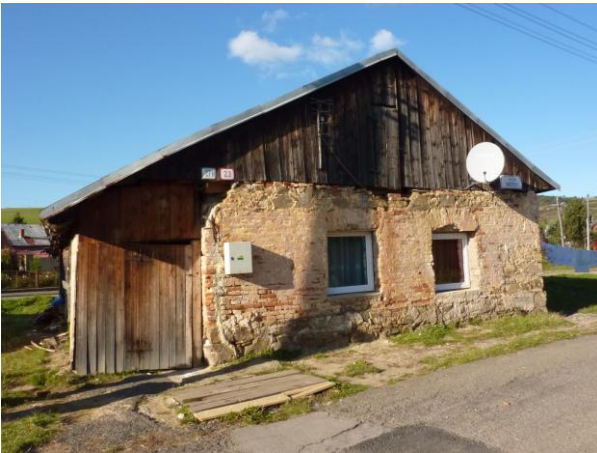
257. Baštová 23 Glos 2010