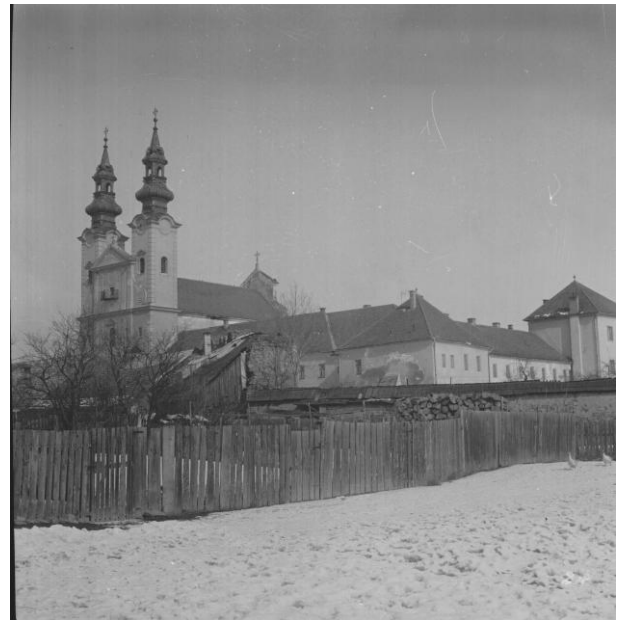
272. Pohľad na Kláštor piaristov NKP z Kláštornej ulice