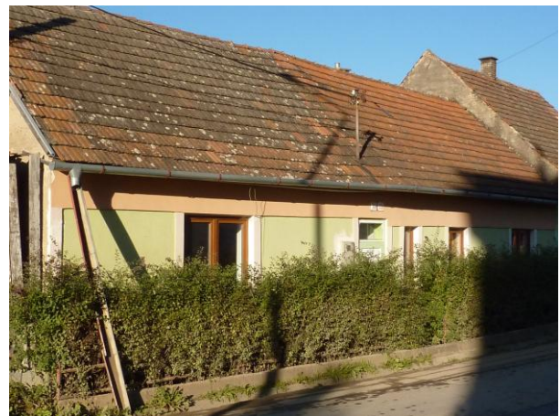
304. Bernolákova 20