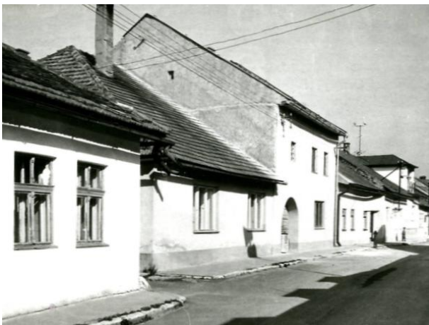
224. Sláma 1988, Letná, Archív PÚ SR č. neg. 101593