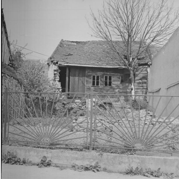
269. Zimná 9/132 z Kláštornej ulice – dvorová fasáda