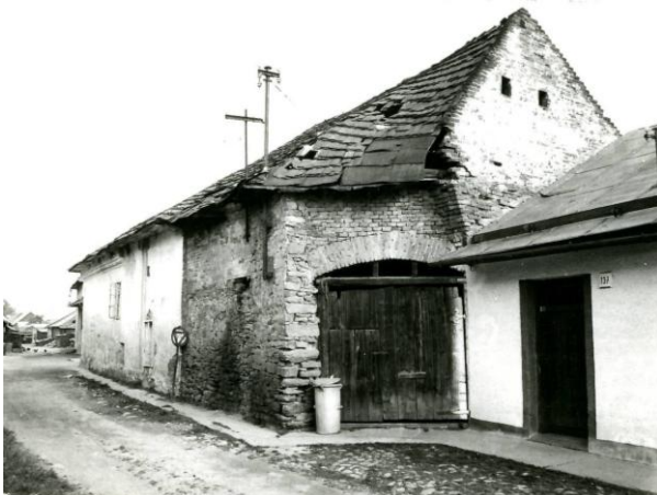
289. Sláma 1988 Archív PÚ SR č. neg. 101600