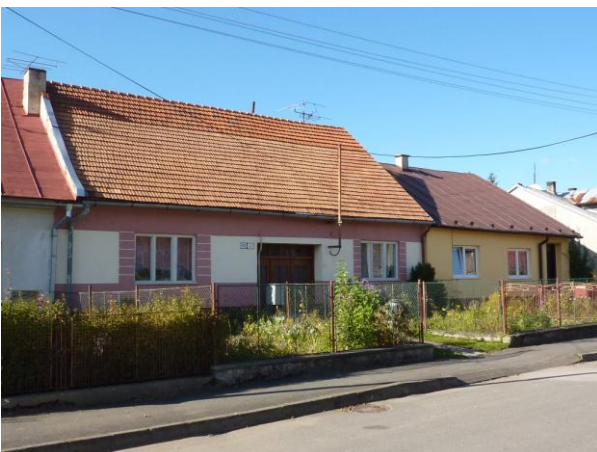
285. J. Smreka, severný front ulice Glos 2010