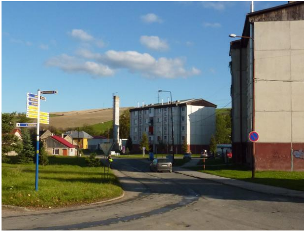
301. Bernolákova ul. - západná časť