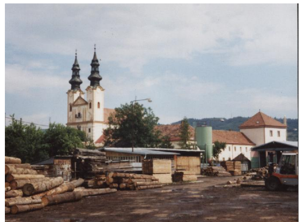
298. Píla – urbanisticky narušený priestor