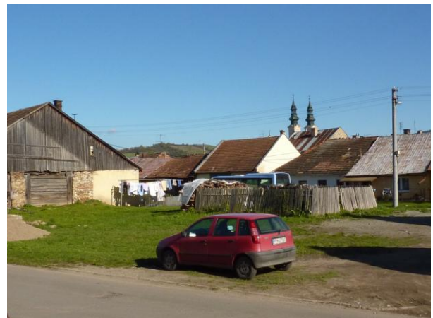
278. Spätný pohľad na Baštovú ul. Glos 2010