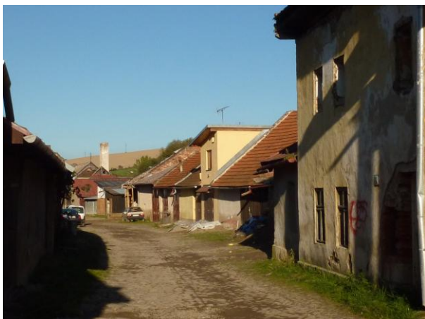
247. Južný front zástavby Zimnej Glos 2010