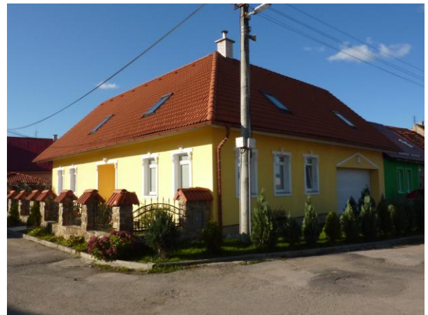
252. Baštová, novostavba nárožného domu