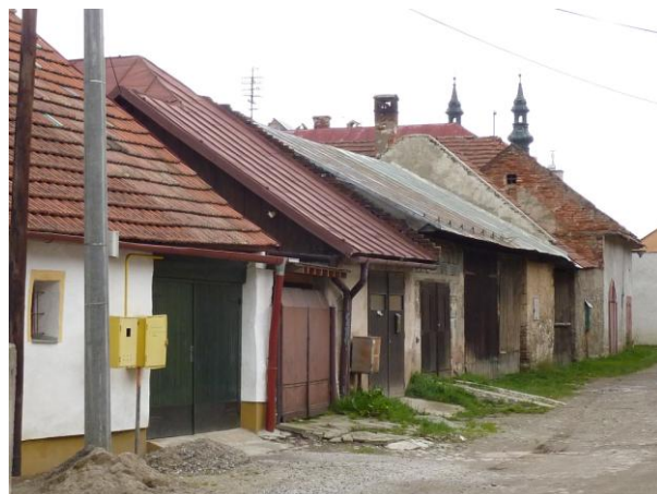
246. Stodoly S frontu Zimnej ulice Glos 2010