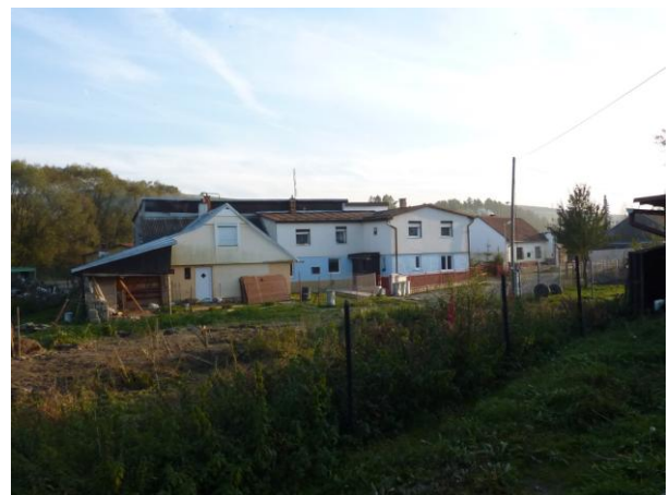
300. Živelná zástavba ul. T. Vansovej Glos 2010