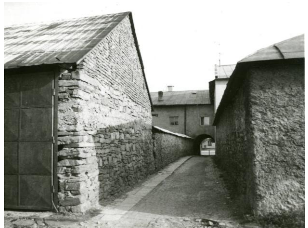
223. Sláma 1988 Archív PÚ SR č. neg. 101610