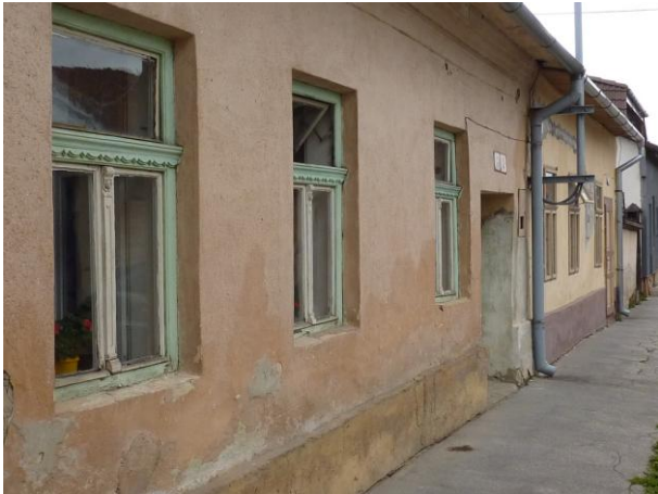
220. Letná 2 a 3 - Tradičné domoradie Glos 2010