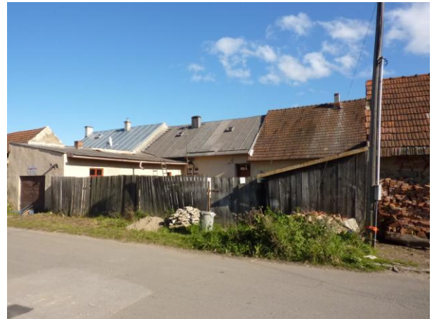
282. Stavebná rezerva pre hosp. stavby Glos 2010