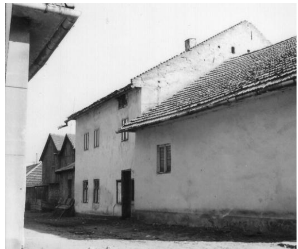
240. Zimná 9 Archív KPÚ Prešov č. neg. 10927-29