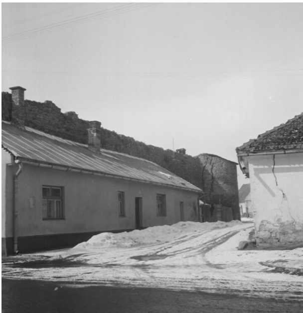
271. Zástavba pri hradobnom múre za OD Jednota