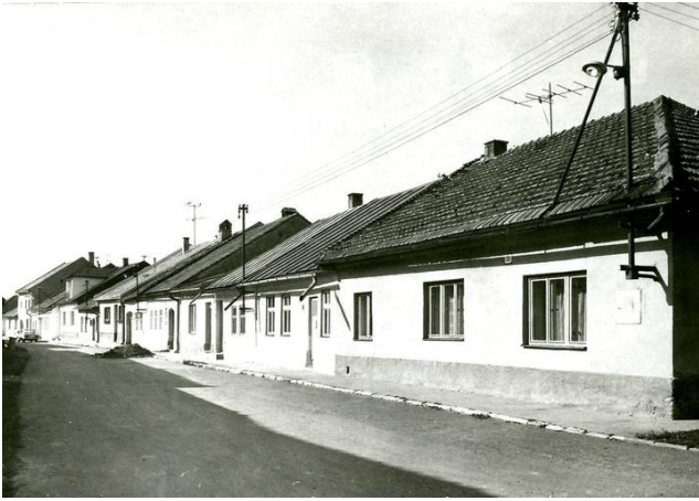
225. Sláma 1988, Letná ul., Archív PÚ SR č. neg. 101595